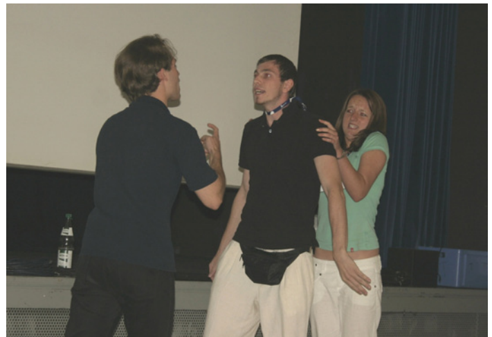
Vorführung eines der neu entwickelten Theaterstücke für PT-Shows