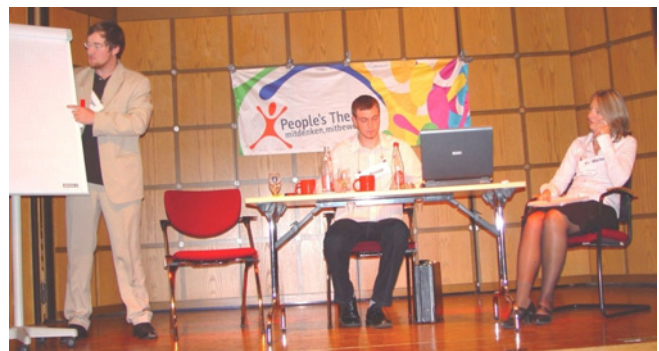
Mitarbeiter eines Unternehmens bei der Planung eines Messestandes

Mitarbeiter, einen einheitlichen Entschluss bei der Planung eines Messestandes ihrer Solarfirma zu fassen. Die überspitzte Darstellung der sehr eigenen Persönlichkeiten ergänzte die inhaltlich ernste Dimension um eine humorvolle Komponente. Auf unterhaltsame Art und Weise gelang es dem Moderator divergierende Meinungen des Publikums zusammenzuführen und mittels eines ausgewogenen Verhältnisses aus Reflexions- und Spielphasen gemeinsam eine annehmbare Lösung zu konstruieren. Viele Teilnehmer kamen nach dem Auftritt mit den Akteuren ins Gespräch und zeigten sich begeistert von dem Potential des Mediums Theater zur Konfliktbewältigung.