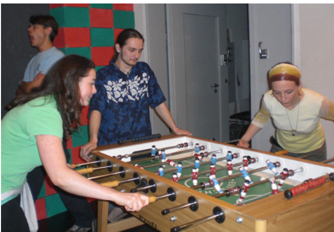
Unterhaltung: Kickerturnier im Proberaum