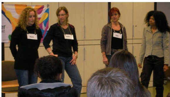
Die Teilnehmer gestalten die Show

(kg) Ende vergangenen Jahres reiste ein Team von PT nach Luxemburg, um den zweiten Teil des Seminars für Sozialpädagogen, Psychologen und Lehrer durchzuführen, die vom schulpsychologischen Dienst „Centre de psychologie et d'orientation scolaires“ vermittelt wurden. Im Juni 2007 war die Seminargruppe bereits in die Materie eingeführt worden.