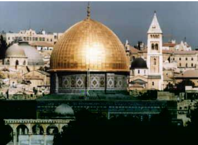
Der Felsendom in Jerusalem

In der letzten Märzwoche wird People's Theater Besuch von einer jungen Theatergruppe aus Kiryat Ono, der israelischen Partnerstadt des Kreises Offenbach, bekommen. Den 14-17jährigen israelischen Jugendlichen soll das Konzept der People's Theater Show vermittelt werden, indem die Jugendlichen zusammen mit People's Theater Shows an deutschen Schulen durchführen werden. Darüber hinaus stehen sowohl Ausflüge in den Odenwald und nach Mainz als auch der Besuch der jüdischen Gemeinde