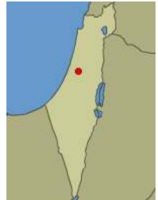
Der Rot gekennzeichnete Punkt: Kiryat Ono